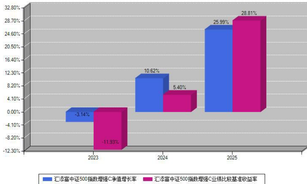
汇添富中证500指数增强C每年净值增长率与同期业绩基准收益率对比图

注：数据截止日期为2025年12月31日，基金的过往业绩不代表未来表现。本《基金合同》生效之日为2023年04月25日，合同生效当年按实际存续期计算，不按整个自然年度进行折算。