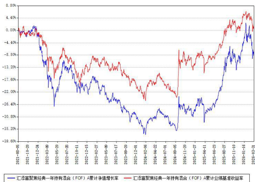
汇添富聚焦经典一年持有混合（FOF）A累计净值增长率与同期业绩基准收益率对比图