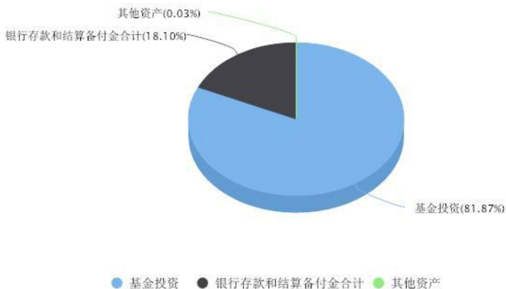
投资组合资产配置图表 数据截止日期:2026年03月31日