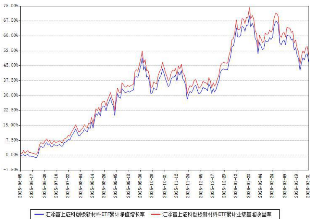
汇添富上证科创板新材料ETF累计净值增长率与同期业绩基准收益率对比图