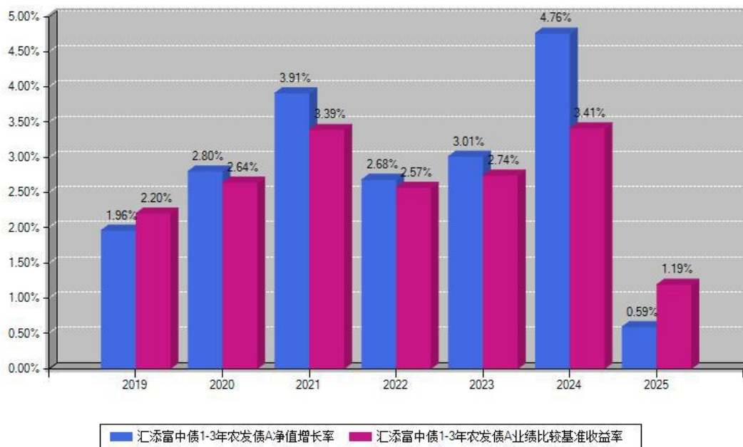
汇添富中债1-3年农发债A每年净值增长率与同期业绩基准收益率对比图

注：数据截止日期为2025年12月31日，基金的过往业绩不代表未来表现。本《基金合同》生效之日为2019年06月19日，合同生效当年按实际存续期计算，不按整个自然年度进行折算。