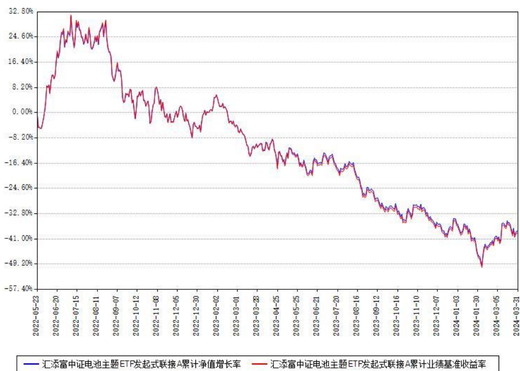
汇添富中证电池主题ETF发起式联接A累计净值增长率与同期业绩基准收益率对比图

(二)自基金合同生效以来基金累计净值增长率变动及其与同期业绩比较基准收益率变动的比较图